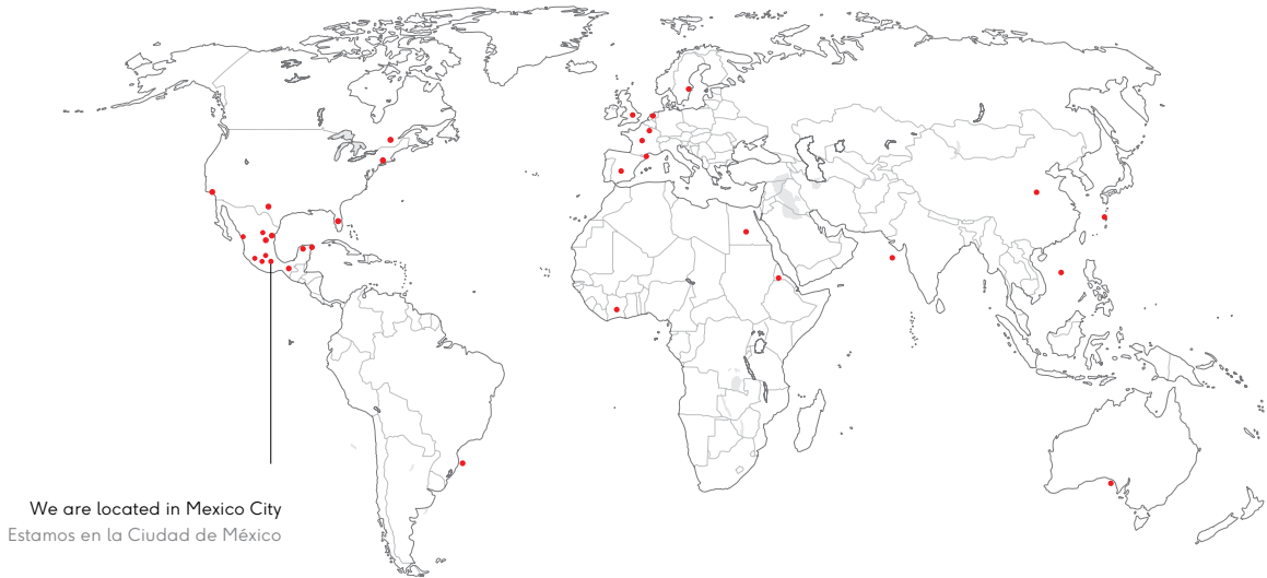
• Were our clients are located, until now. Donde se ubican nuestros clientes, hasta ahora.

Disfrutamos el desarrollo de marcas desde cero. Hemos trabajado en la creación de distintos proyectos, como restaurantes, bares, bebidas, productos alimenticios, marcas de moda, despachos de arquitectura, identidades de fotógrafos, etc. Pero también trabajamos con empresas ya establecidas como Heineken, Lacoste, CEMEX, entre otras.